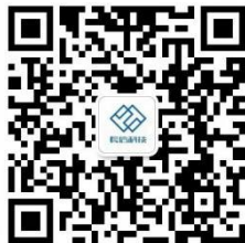
校招微信, 欢迎添加